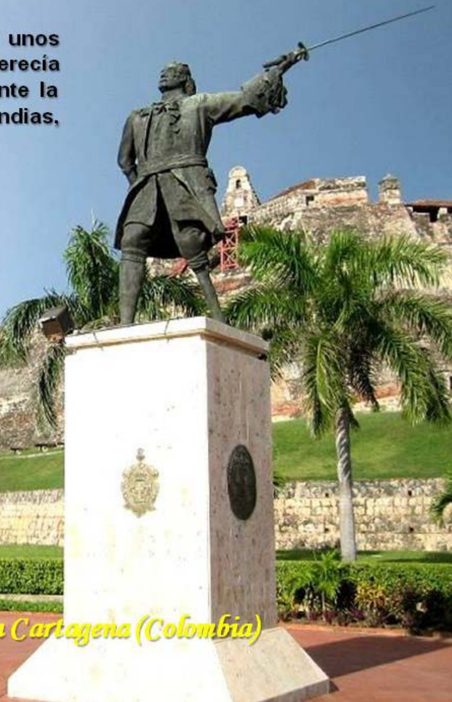
Monumento a Blas de Lezo en Cartagena (Colombia)

Blas de Lezo muere en Cartagena de Indias unos meses después sin los honores que merecía debido a los enfrentamientos que tuvo durante la batalla con el virrey de Cartagena de Indias, Sebastián de Eslava. ¡Vergonzoso!